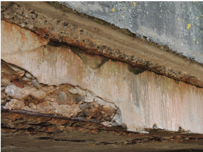
Degradace betonu nosné konstrukce a korodující výztuž