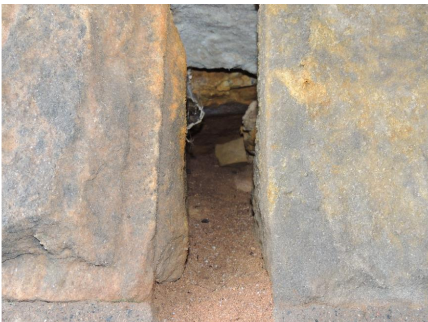
Vyústění drenážního opatření přechodových oblastí mostu skrz levou opěru