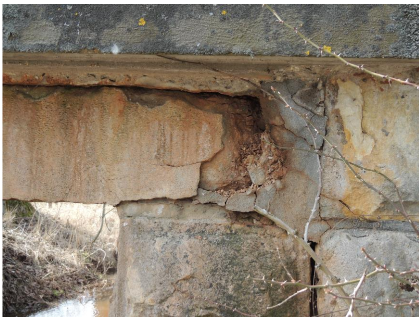
Degradovaný beton v uložení nosné konstrukce na levou opěru, popraskané a vydrolené stykové spáry levé opěry – výtoková část