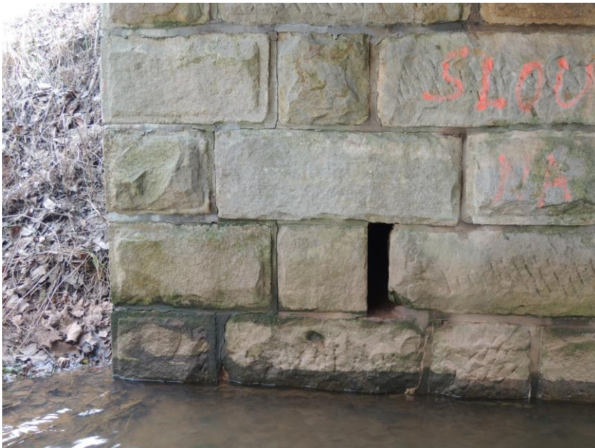
Vyústění drenážního opatření přechodových oblastí mostu skrz pravou opěru