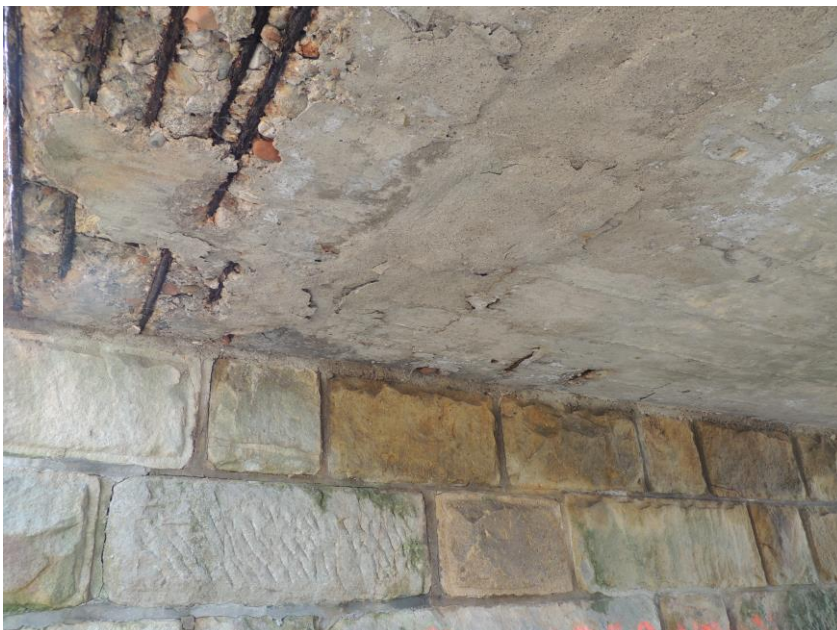
Trhliny v podhledu nosné konstrukce vlivem korodující výztuže a korodující výztuž