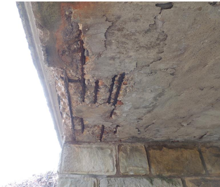
Korodující výztuž, separace betonu od výztuže