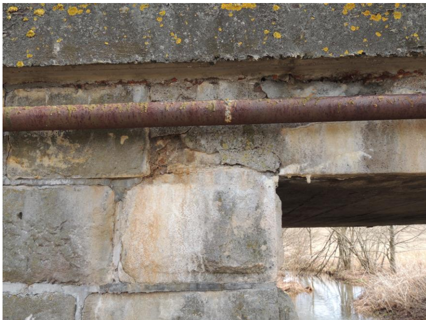
Degradovaný beton nosné konstrukce v uložení na levou opěru, popraskané stykové spáry pravé opěry – vtoková část