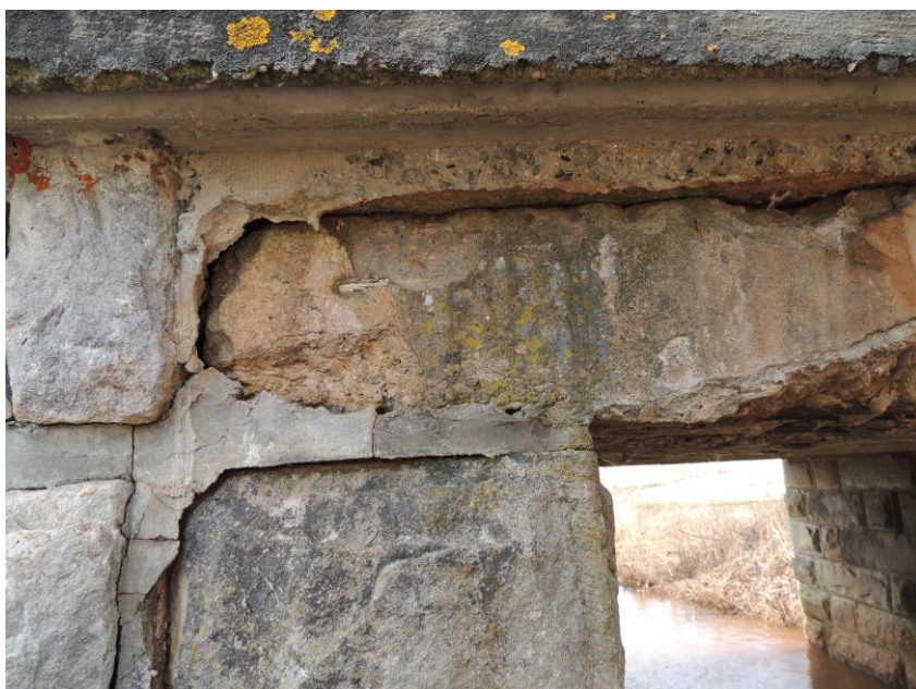
Degradovaný beton v uložení nosné konstrukce na pravou opěru, popraskané a vydrolené stykové spáry pravé opěry – výtoková část